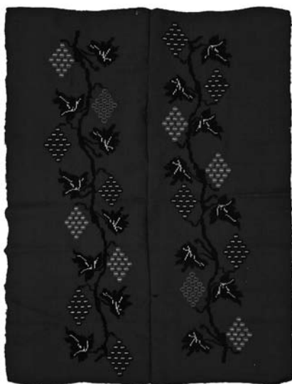
Кат. бр. 4, ирам инв. бр. 274;