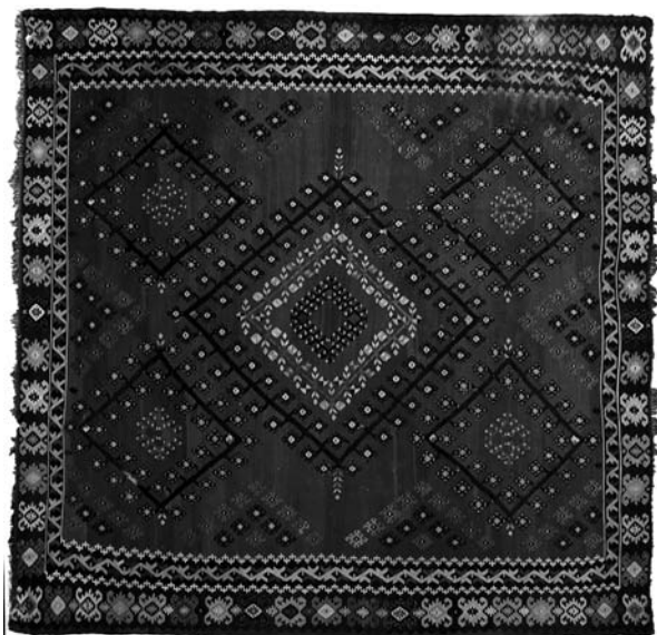
Кат. бр 24, пиротски ћилим инв. бр. 812;

Пиротски ћилим ткан у два нита са клечаном орнаментиком. „Поље“ ћилима је од црвене вуне са мотивом „софрица“ од црне вуне (у облику ромбова у средини и угловима). „Окрајница“ је дупла од црвене вуне (са мотивом „жељки“) и црне вуне (мотив „луткица“) а на ужим странама су ресе. Без података