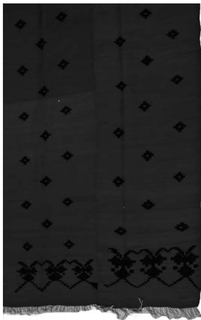
Кат. бр. 16, ћилим „на венац“ инв. бр. 1147