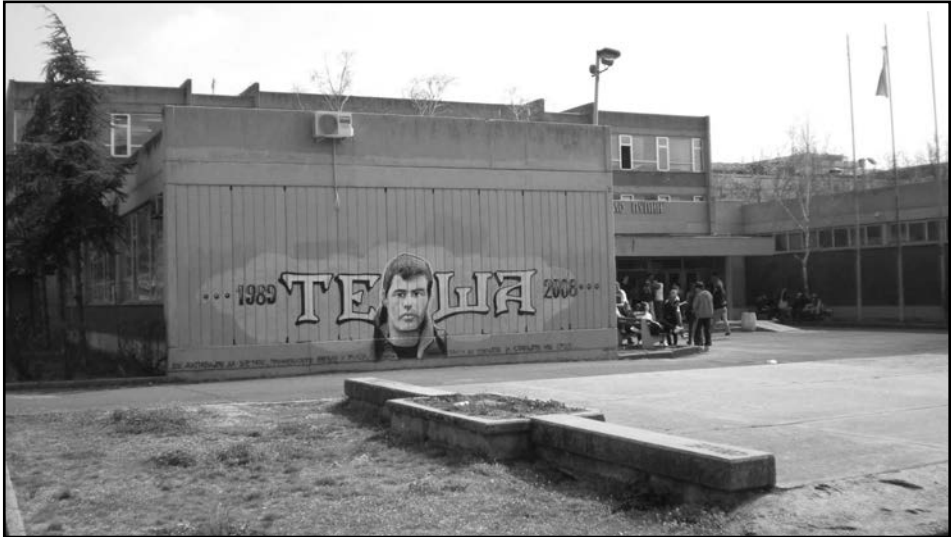
5. Графит крајпуташи, двориште Десете београдске гимназије, општина Нови Београд, сликао Данило Трбојевић, 2009.