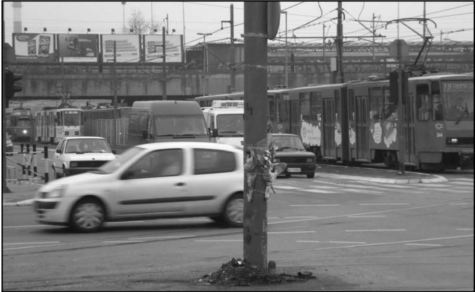
1. Бандера крајпуташи, снимљено на раскрсници код железничке станице Нови Београд, 2009.