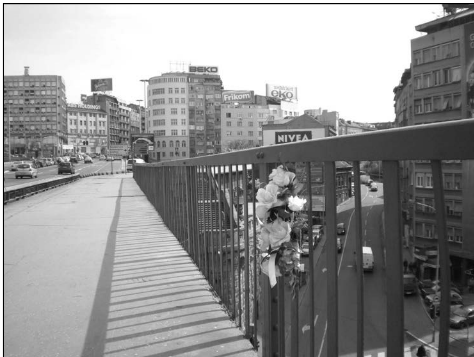
7. Венац на месту погибије, покрај Бранковог моста, општина Стари град, сликао Данило Трбојевић, 2009.