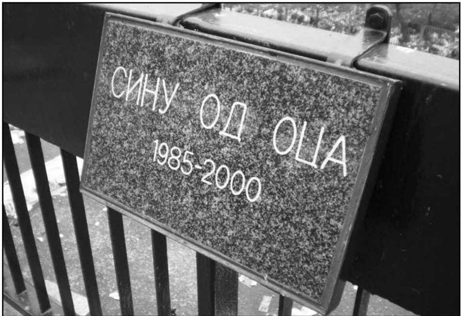
2. Плоча крајпуташи постављена на ограду железничке станице Нови Београд, 2009.