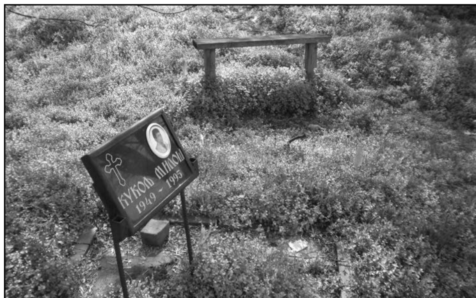
4. Крајпуташ са клупицом, недалеко од станице аутобуса бр. 73, општина Нови Београд, 2009.