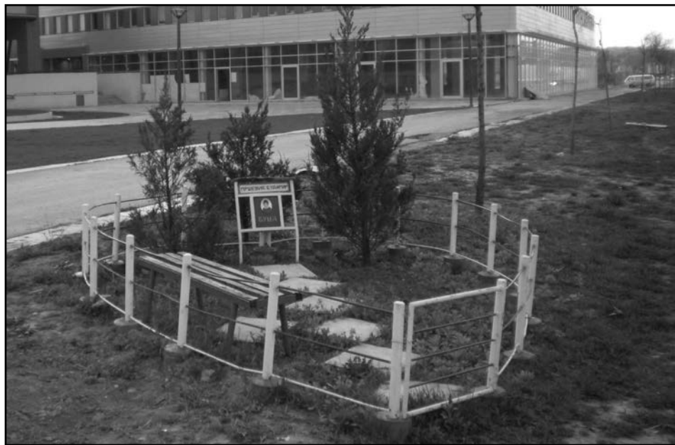
3. Крајпуташ у облику срца, налази се недалеко од Експо центра на Новом Београду, сликао Данило Трбојевић, 2009.