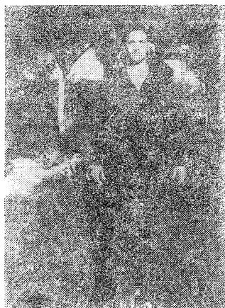
Табла I Фот. бр. 1.