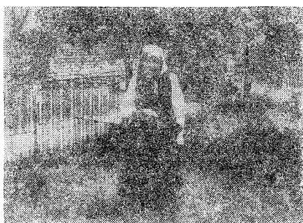
Табла I Фот. бр. 2.