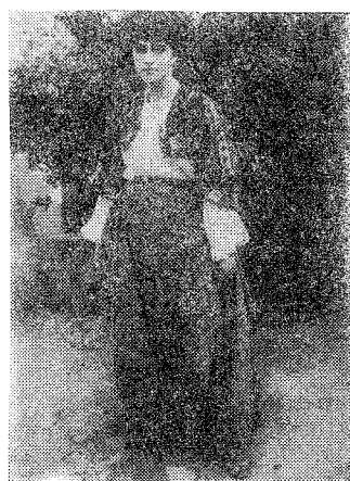
Табла II Фот. бр. 4.