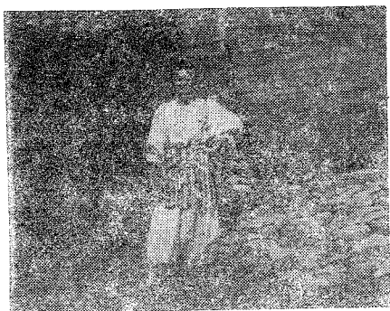
Табла III Фот. бр. 5.