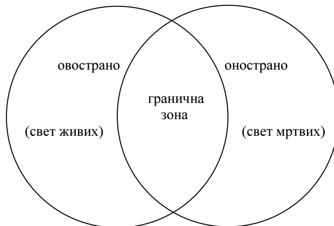
Шема бр. 1

Сусрет ова два света у нашој народној традицији, најчешће се доживљава као "продор" онострани реалности у ово страни амбијент, или њено отелотворење у ово страни ентитету, што се шематски може представити на следећи начин: