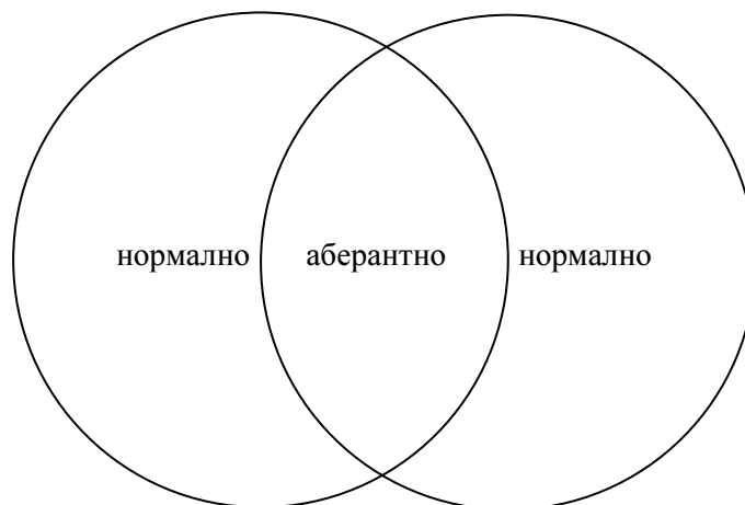
Шема бр. 4

Овакве представе заснивају се на, својеврсном, двоструком дуализму који у дистинкцију онострано/онострано уводи и супротност типа нормално/аберантно, која се у нашим примерима појављује, пре свега, кроз однос присуство/одсуство посмртног ритуала и поштовање/непоштовање правила које прописује традиција. Границе два супротстављена света, дакле, не пробијају сви "становници" оностраног, већ само они покојници које, из било ког од наведених разлога, можемо назвати аберантним. У том случају шема бр. 1 се може представити и на следећи начин: